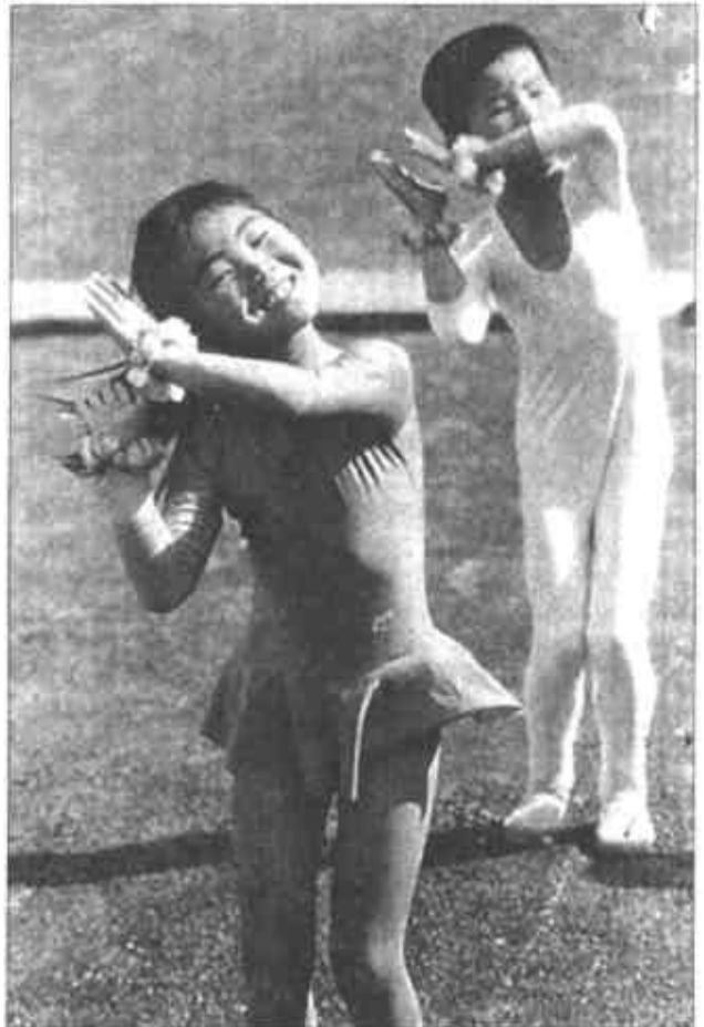
儿童的健康成长。他围绕爱国主义教育这一主线，巩固和发展了少先队活动阵地，带领全乡少先队工作者开展了“我为灾区小伙伴献爱心”、“保护母亲河行动”、“迎澳门、庆华诞”等活动，让少年儿童独立自主地开展活动，唤起了孩子们参与少先队活动的兴趣，取得了显著成效。