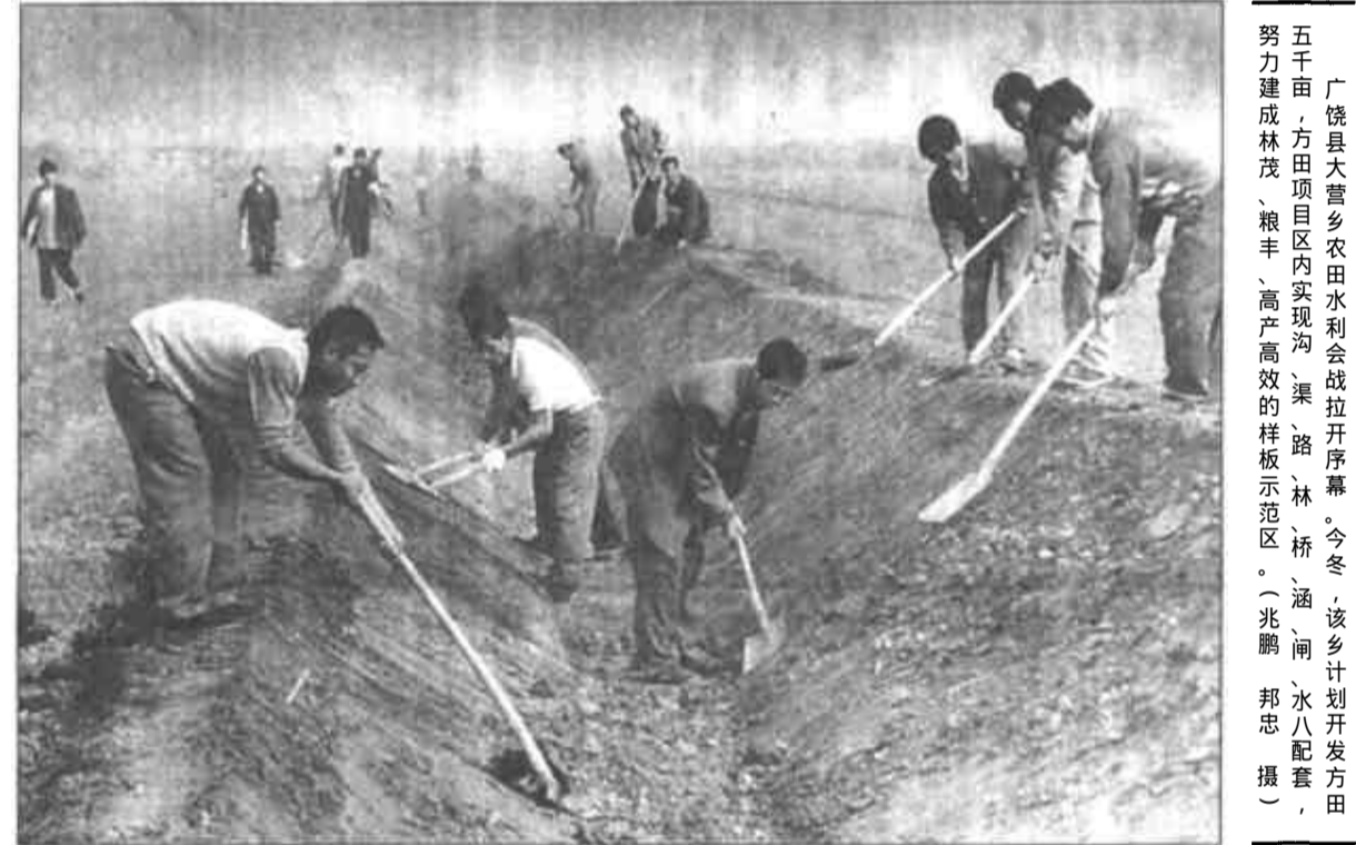
拓展合作领域 延伸合作层次

学、讲科学、用科学的良好社会风气。要抓住有利时机，组织重大战役，为迎接澳门回归和新世纪到来创造良好氛围。进一步坚定人民群众建设有中国特色社会主义的信念，适应新形势、新情况、新任务，切实加强思想政治工作，用马克思主义思想牢固占领文化思想阵地。创建活动要与完成我市的改革发展任务相结合，同维护社会稳定相结合，充分发挥精神文明建设工作的政治优势，唱响主旋律，不断营造团结奋进、欢乐喜庆、昂扬向上的社会氛围。